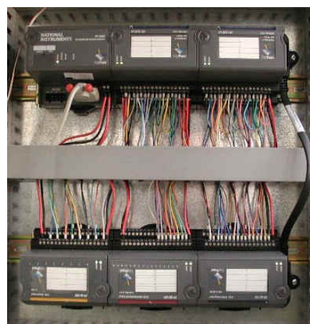
Figura 3. Dispositivi di I/O NI FieldPoint